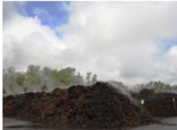
Andains en cours de fermentation

Il est nécessaire d'avoir à disposition un espace suffisant pour la décomposition de ces déchets. Les plateformes de compostages sont des espaces adaptés et réservés pour ce processus.