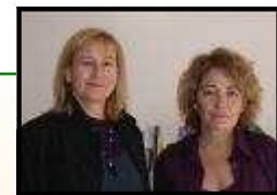
PAR LYLIAN ALBO ET NADINE VIALA (FERRIÈRES)

Ce gâteau, création locale de « BIOT », par un boulanger du coin dit « Le Duc », au siècle dernier, se mange froid, seul ou accompagné d'une crème à votre convenance.