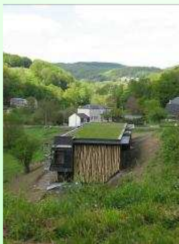
Cabinet Basalt Architecture

Ainsi le visiteur est-il convié à un parcours pleinement historique, laïque, comparatiste. Avec cette espérance, sinon la certitude, que connaître son passé et celui de l'autre est une des meilleures manières d'apprendre à vivre ensemble.